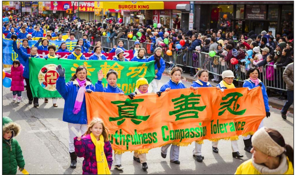
图：纽约法拉盛新年游行，法轮功队伍受到民众欢迎。

大年初八，悉尼市政府一年一度的“中国新年花灯巡游庆典”吸引超过十万观众沿街观看，天国乐团雄壮