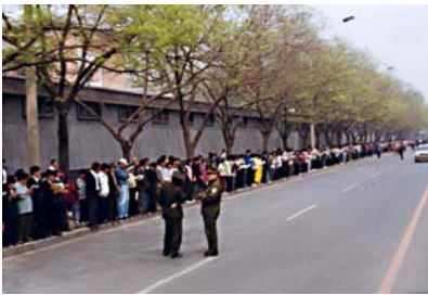
“四·二五”上访，法轮功学员没有口号，没有标语，秩序井然，警察在一旁聊天。

法轮功学员所表现出的和平理性，得到了国际社会的高度评价，“四·二五”上访被称作“中国历史上最理性平和的大规模上访”。然而江泽民出于妒忌，强行把和平上访歪曲成“围攻中南海”，并于 1999 年 7 月开始全面迫害法轮功。◇