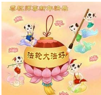
北京军队四总部法轮功学员制作的贺卡

过年是中国人最隆重的传统节日，也是人们团聚、问候和感恩的日子。从 2001 年开始，在海外网络上出现了一道独特的风景：世界各地的法轮功学员和各界民众在新年佳节之际，纷纷将节日贺词、自制贺卡、诗歌等寄给明慧网，向法轮功创始人李洪志先生拜年，并表达诚挚的敬仰和感恩。