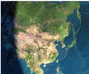
中国水土流失面积占国土的 38%，近 4 亿人口的耕地和家园处于沙漠化威胁之中。

全国受到重金属污染威胁的耕地占农田总数的六分之一，达 3 亿亩。每年被重金属污染的粮食达 1200 万吨。近年来日益严重的重金属污染，还导致大陆儿童铅中毒事件频频发生。