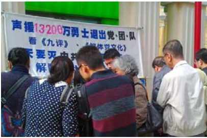
2013 年中国新年期间，大陆游客在澳门景点观看真相展板，很多游客用化名“三退”。至今，声明退出党、团、队的中国人已经到达一亿三千多万。

并不是为了搞政治，也不只是为了反迫害，而是为了挽救民族的道德，捍卫中国人的生存权。◇