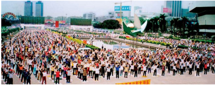
迫害前广州法轮功学员集体炼功

大法给予我的太多太多，我唯有精进实修，才能回报师父的救度之恩。愿更多的善良人都能来了解真相，不要与美好的机缘失之交臂。（文／大陆法轮功新学员 善缘）◇