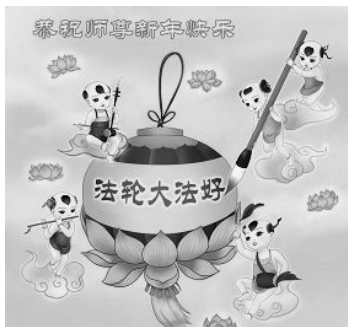
北京军队四总部法轮功学员制作的贺卡

过年是中国人最隆重的传统节日，也是人们团聚、问候和感恩的日子。从 2001 年开始，在海外网络上出现了一道独特的风景：世界各地的法轮功学员和各界民众在新年佳节之际，纷纷将节日贺词、自制贺卡、诗歌等寄给明慧网，向法轮功创始人李洪志先生拜年，并表达诚挚的敬仰和感恩。