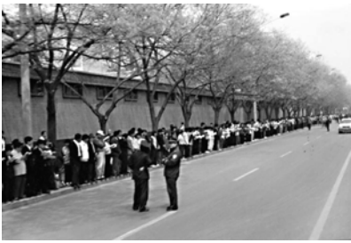
“四·二五”上访，法轮功学员没有口号，没有标语，秩序井然，警察在一旁聊天。

法轮功学员所表现出的和平理性，得到了国际社会的高度评价，“四·二五”上访被称作“中国历史上最理性平和的大规模上访”。然而江泽民出于妒忌，强行把和平上访歪曲成“围攻中南海”，并于 1999 年 7 月开始全面迫害法轮功。◇