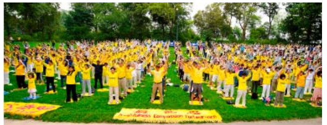
法轮功学员在纽约曼哈顿中央公园集体炼功

迄今为止，法轮功已弘传世界100多个国家和地区，其主要著作已被翻译成30多种语言出版发行；李洪志先生及法轮功在世界各地受到人们的高度评价，获各国政府、国际组织给予的褒奖和支持议案信函等3000多项；修炼者的足迹遍及天涯海角，世界各族裔的科学家、艺术家，不同阶层的民众跨越语言的障碍，种族的藩篱，走上了修炼法轮大法的共同之路。