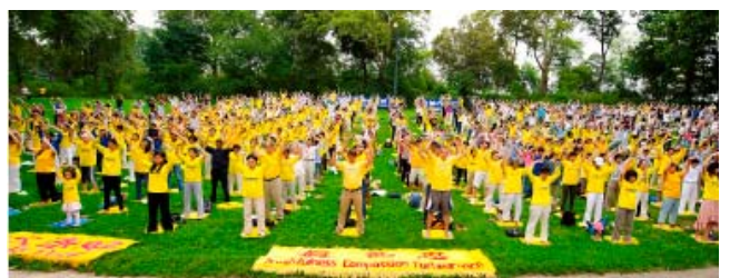
法轮功学员在纽约曼哈顿中央公园集体炼功

迄今为止，法轮功已弘传世界100多个国家和地区，其主要著作已被翻译成30多种语言出版发行；李洪志先生及法轮功在世界各地受到人们的高度评价，获各国政府、国际组织给予的褒奖和支持议案信函等3000多项；修炼者的足迹遍及天涯海角，世界各族裔的科学家、艺术家，不同阶层的民众跨越语言的障碍，种族的藩篱，走上了修炼法轮大法的共同之路。