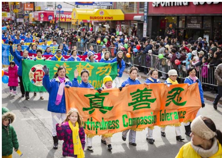
法轮功学员参加纽约法拉盛华人新年游行

用海外信箱给 freeget.ip@gmail.com 发电子邮件 (标题不能空白), 10 分钟内会拿到几个 IP。突破网络封锁, 上到动态网首页点明慧网 minghui.org 链接, 了解更多真相。