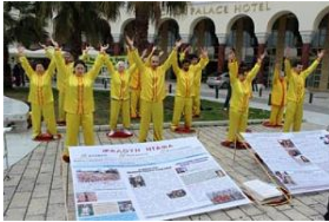
图：2013年2月23日至24日，希腊法轮功学员在第二大城市萨洛尼卡中心和海滨传播真相，让更多人了解以“真、善、忍”为修炼原则的法轮功以及发生在中国的迫害事实。法轮功如今已弘传世界一百多个国家和地区。

轮功的主要著作），三天看完了《转法轮》，这本书解开了我心中的疑惑，我明白了这是真正的佛法，我下了决心，这辈子我要坚持在这一条路上走下去。从那以后，我们夫妻俩基本上