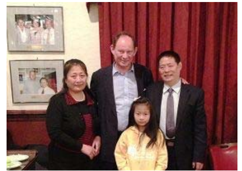
图：史考特先生与张连英全家的合影

【明慧网】二零一三年三月四日，欧洲议会副主席爱德华·麦克米兰·史考特来美国华盛顿 DC 参加中国人权听证会之际，与他这几年一直参与积极营救的法轮功学员张连英一家相聚。而对于能在华府再见到当初营救的对象，史考特一行也相当激动；对于中共持续对法轮功学员的迫害，史考特表示说：“这日子不会长了。”