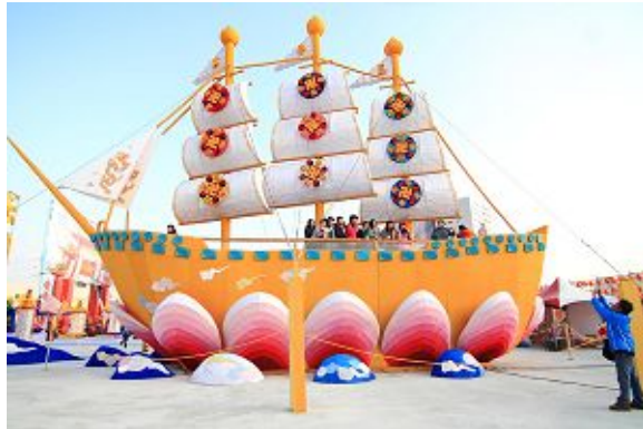
法轮功学员纯手工打造的巨型“法船”

三月九日下午，天国乐团从法轮大法学员的灯区出发游行，浩荡的队伍行进至主灯前时，现场观众自动让出一条路来，天国乐团的队