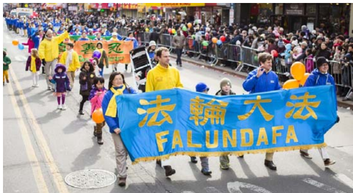
图：法轮功学员参加纽约法拉盛华人新年游行