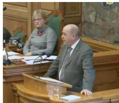
图：丹麦国会举办“共产中国的司法状况”答辩会，关注中共活摘器官罪行

【明慧网】丹麦国会二零一三年二月二十二日举办了题为“共产中国的司法状况”答辩会。这是由丹麦资深议员、丹麦人民党副主席索伦·艾斯普森就中共活体摘取法轮功学员器官等严重人权问题的现状，向丹麦外交大臣提出质询的答辩会。