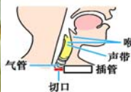
气管切开插管示意图

并且说话底气十足，还对着麦克风唱歌！被海外医学界人士戏称中央电视台“创造了医学奇迹”。注：切开气管手术要把插管伸到声道以下的喉咙里，以便病人呼吸。此时病人不能用嘴呼吸，气流进不到声带和喉部，所以不能说话。如病人要说话，需堵住这个插管，但声音是断断续续、不连贯、漏气的。