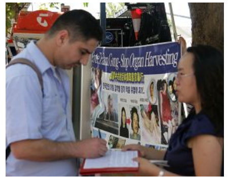
民众签名制止中共活体摘取法轮功学员器官

除了在景点的征签，学员们还走进了一个个的商家，张贴《制止中共活摘法轮功学员器官》的海报，