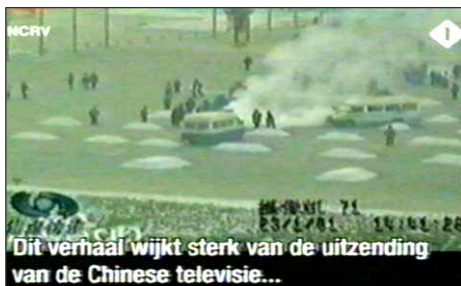
图：荷兰国家电视一台 2005 年 3 月 14 日《时事评论》节目揭露“天安门自焚”伪案，质疑突发事件中两辆警车为何备有（据中共报导）20 多个灭火器。国际教育发展组织 2001 年 8 月 14 日在联合国会议上声明：整个自焚事件是政府导演的。中国代表团面对确凿证据，没有辩辞。

它不知精巧多少倍，整个宇宙的精巧更是无与伦比，你竟然认为无须造物主造就，在长期无序运动中通过无数个偶然叠加，就能产生无比精巧的宇宙，这不荒唐么？这个朋友自此彻底改变无神观念。（文／大陆律师）◇