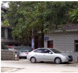
下关区洗脑班（自诩为“爱心家园”，2010 年搬至建宁路 118 号某铁路学校旧址）

庞浩看到妻子一脸憔悴与红肿的双眼，听着妻子的哭诉，露出十分痛苦的表情。唐国防察言观色，觉得有机可乘，利用修炼人的善良，借钱明芳之嘴表达“关心”，