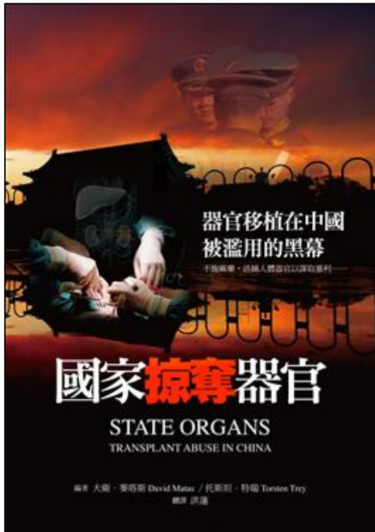
图：《国家掠夺器官》汇集多国医学专家、伦理学教授和国会议员等提供的大量事实、统计数据、证人证词及相关分析，揭示在中国发生的活摘器官的非法行为。

中共在器官移植供体来源问题上数度改口，这尴尬确实事出有因。据中国大陆官方公布的统计数据，在一九九四年到九九年的六年中，