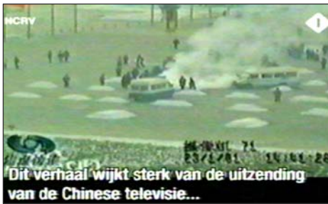
图：荷兰国家电视台 2005 年 3 月 14 日《时事评论》节目揭露“天安门自焚”伪案，质疑突发事件中两辆警车为何备有（据中共报导）20 多个灭火器。国际教育发展组织 2001 年 8 月 14 日在联合国会议上声明：整个自焚事件是政府导演的。中国代表团面对确凿证据，没有辩辞。

它不知精巧多少倍，整个宇宙的精巧更是无与伦比，你竟然认为无须造物主造就，在长期无序运动中通过无数个偶然叠加，就能产生无比精巧的宇宙，这不荒唐么？这个朋友自此彻底改变无神观念。（文／大陆律师）◇