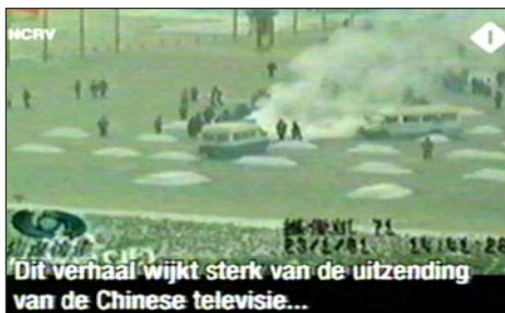
图：荷兰国家电视一台 2005 年 3 月 14 日《时事评论》节目揭露“天安门自焚”伪案，质疑突发事件中两辆警车为何备有（据中共报导）20 多个灭火器。国际教育发展组织 2001 年 8 月 14 日在联合国会议上声明：整个自焚事件是政府导演的。中国代表团面对确凿证据，没有辩辞。

它不知精巧多少倍，整个宇宙的精巧更是无与伦比，你竟然认为无须造物主造就，在长期无序运动中通过无数个偶然叠加，就能产生无比精巧的宇宙，这不荒唐么？这个朋友自此彻底改变无神观念。（文／大陆律师）◇