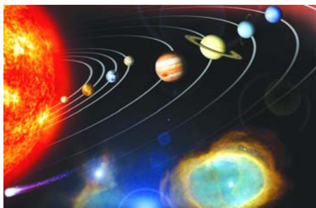
图：太阳系通过偶然叠加就能产生吗？

牛顿答：没有人造，它自己偶然形成的。朋友笑道：真荒唐，这么精巧的东西怎么会自己产生？牛顿回答：这只是个模型，真正的太阳系比