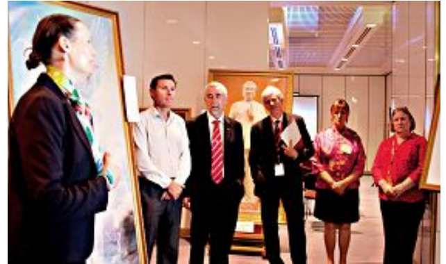
澳大利亚国会议员们在听解说员讲解真善忍美展作品。

真善忍美展的作品是由一群修炼法轮功的艺术家们所创作。作品展现了法轮大法修炼的美好，以及众多法