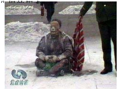
□ 央视录像中，被“大火烧过的”王进东，两腿间盛汽油的塑料雪碧瓶翠绿如新，最易着火的头发也很完整，警察拎着灭火毯等着拍戏。

够拍摄整个天安门广场的长焦镜头，被解释说是大会堂上面的监视器，但是监视器是固定的，而自焚画面中镜头是紧跟事件发展移动的。麦克风能录下洪亮的口号，摄影师能拍到各种大特写，甚至抓拍到小孩喊妈妈的镜头。显然，这场“自焚”是中共导演和拍摄的煽动