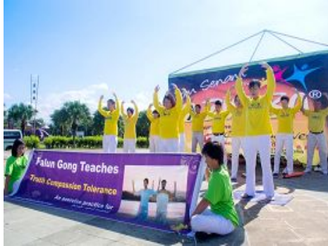
图：马来西亚法轮功学员示范五套功法

相比其它热闹的健康操，一位马来年轻摄影师被法轮功祥和与慈悲的能量场所震撼，在赞叹之余不停地拍照，恐怕失去任何一个珍贵的镜头。功法示范完毕后，这位青年还主动表示，希望学员能给他进一步讲解