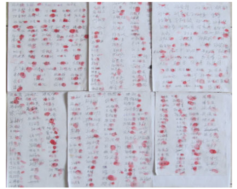
图:营救孙玉强的 432 个签名和手印。

◆周向阳 一年多来燕赵大地上,一对年轻人在中共迫害下的苦难故事,感动了许多民众,先后引发秦皇岛 2300 民众联名营救青年工程师周向阳,唐山丰润 528 位民众联名营救他的妻子李珊珊。民众看到这对善良夫妻的故事《七年等待九年冤狱》后,又有许多人为至今被关在石家庄劳教所的法轮功学员李珊珊鸣不平,日前又有 939 人联名呼吁释放。