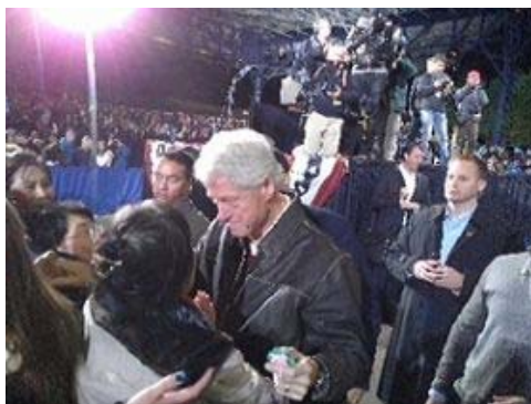
克林顿总统拥抱法轮功学员于真洁

美国前总统克林顿前往华盛顿 DC 地区维吉尼亚的 Bristol，参加民主党的一个活动时听到法轮功真相，克林顿对曾在中国受到迫害的两位华府法轮功学员说：“我感到抱歉，你们受苦了！”