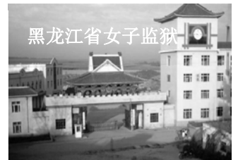
黑龙江省女子监狱