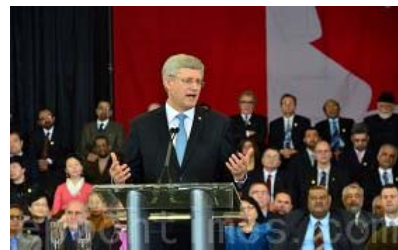
▲加拿大总理哈珀宣布成立宗教自由办公室

二零一三年二月十九日，加拿大总理哈珀宣布，在外交部成立宗教自由办公室，并表示，法轮功信仰团体在中国遭受的迫害，是加拿大政府的关注之一。