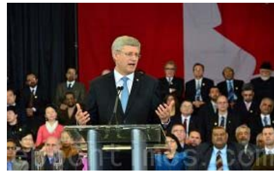
▲加拿大总理哈珀宣布成立宗教自由办公室

二零一三年二月十九日，加拿大总理哈珀宣布，在外交部成立宗教自由办公室，并表示，法轮功信仰团体在中国遭受的迫害，是加拿大政府的关注之一。