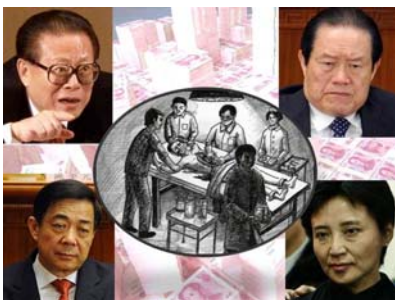
图：在江氏“打死算自杀”、“不查身源，直接火化”的指令下，薄谷夫妇犯下活摘法轮功学员器官的罪行。

薄熙来下令辽宁所有劳教所、监狱，“集中全部力量转化法轮功”。在迫害法轮功的血雨腥风之中薄熙来的官运亨通扶摇直上。期间薄熙来新建、扩建了沈阳马三家劳教所、龙山教养院、沈新劳教所等，于是辽宁省就成了迫害法轮功及活摘法轮功学员器官罪恶最严重的灾区。