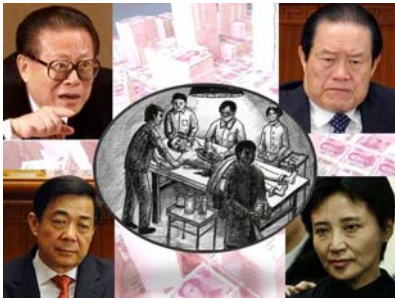
图：在江氏“打死算自杀”、“不查身源，直接火化”的指令下，薄谷夫妇犯下活摘法轮功学员器官的罪行。

薄熙来下令辽宁所有劳教所、监狱，“集中全部力量转化法轮功”。在迫害法轮功的血雨腥风之中薄熙来的官运亨通扶摇直上。期间薄熙来新建、扩建了沈阳马三家劳教所、龙山教养院、沈新劳教所等，于是辽宁省就成了迫害法轮功及活摘法轮功学员器官罪恶最严重的灾区。