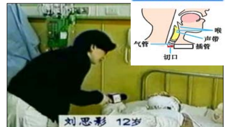
气管切开插管示意图

国际教育发展组织（IED）2001年8月14日在联合国会议上，就天安门自焚事件声明说：从录像分析表明，整个事件是“政府一手导演的”。中国代表团面对确凿的证据，没有辩辞。该声明已被联合国备案。