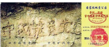
图：贵州“藏字石”显现“中國共產黨亡”六个大字（图为风景区门票），昭示着“天灭中共”的天意。

随着法轮功真相、《九评共产党》的广泛传播，越来越多的中国人看清了中共的邪教本质，作出明智的选择：声明退出它的党、团、队组织（三退）。在海外大纪元网站上，一亿三千万勇士加入“三退”大潮，宣布与中共决裂，可以说中共这个邪教灭亡之日不远了！◇