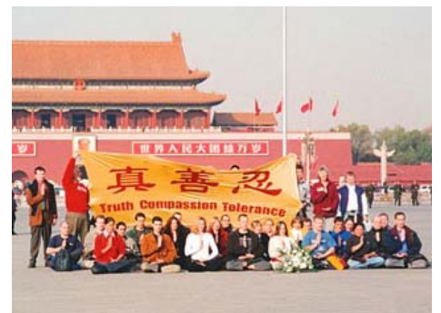
图：2001 年 11 月 20 日，35 名西人法轮功学员在天安门广场打出“真善忍”横幅为法轮功进行和平请愿，数分钟后全部遭到中国警察逮捕。

底无私天地宽”，“先天下之忧而忧”，“留取丹心照汗青”的高贵豁达。有道是，做好人还怕啥呢？不要小看那个大陆官员“真善忍有什么好？”的雷人之语，中国社会这十几年来的道德堕落，就是从中共迫害法轮功，社会蔑视“真善忍”开始的。