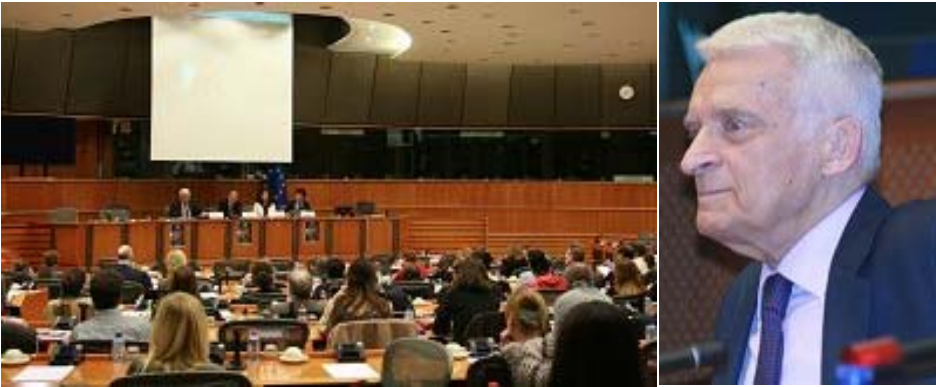
左：《自由中国》在欧洲议会会议厅放映 右：上届欧洲议会轮值主席布泽克教授