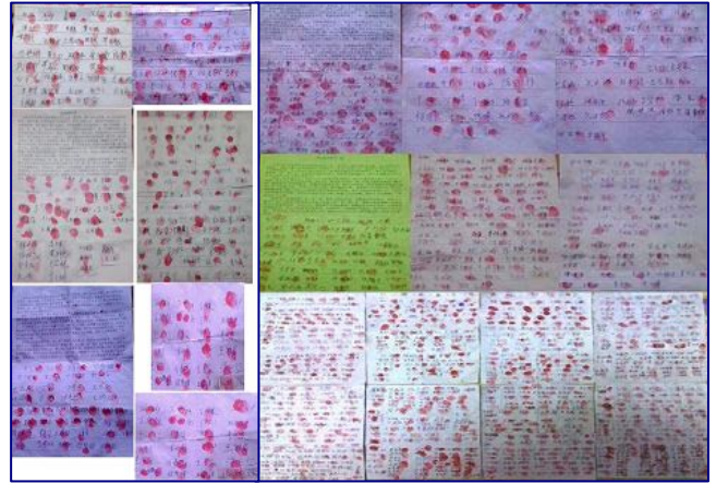
青龙满族自治县各乡镇第二批为崔爱军征签 1841 人

印卿就是不放人，执意继续迫害崔爱军，还扬言：在（中共）两会后，再给崔爱军罗列点东西，再给检察院报上去。青龙县国保大队副队长竟叫嚣：法轮功学员零口供、不签字，照样能给判了。