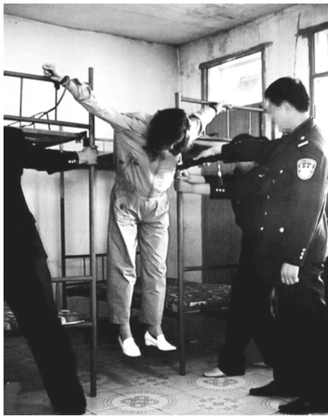
图片说明：酷刑演示“抻刑”

这些年来中共的劳教制度的非法性受到了海内外的广泛谴责，在这样的形势下，中共一边继续这场迫害法轮功的政治运动，一边把被关押在劳教所的法轮功学员们转移到监狱继续关押，更有甚者，越来越多法轮功学员被非法判重刑。