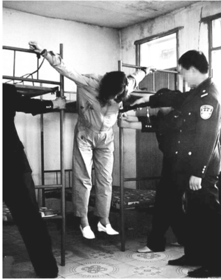
图片说明：酷刑演示“抻刑”

这些年来中共的劳教制度的非法性受到了海内外的广泛谴责，在这样的形势下，中共一边继续这场迫害法轮功的政治运动，一边把被关押在劳教所的法轮功学员们转移到监狱继续关押，更有甚者，越来越多法轮功学员被非法判重刑。