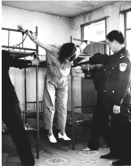
图片说明：酷刑演示“抻刑”

在迫害的早期，中共主要用非法的劳教制度肆意绑架和劳教法轮功学员，用酷刑折磨、强制洗脑来迫使法轮功学员放弃信仰。明慧网 2000 年至今 13 年来共有 8109 篇报道和期刊揭露和谈论法轮功学员在马三家劳教所受迫害的经历。4 月 7 日晚，中国网易、搜狐、腾讯等多家媒体都在显著位置长篇报道了“辽宁马三家女子劳教所：坐老虎凳、绑死人床、