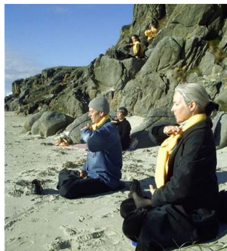
图片说明：西茜在海边炼功

随后这几年中，西茜用自己的积蓄和假期，去各地的健康博览会上介绍法轮功对健康的效应。她的热情讲