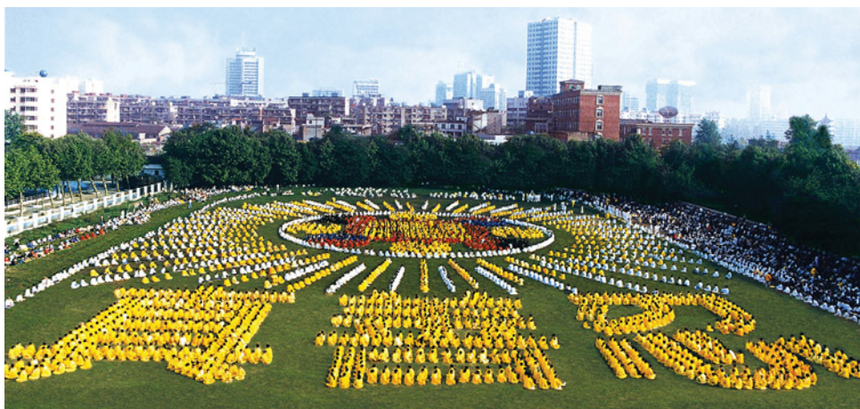
图片说明：李洪志师父在武汉共举办过五期法轮功传授班。法轮功备受武汉人民喜爱。这是 1997 年由 5000 多名武汉法轮功学员集体炼功，列队组字，上部分为法轮图形，下部分为“真善忍”，场面宏大，震撼人心。

那时我们每天早、晚都在炼功点集体炼功、读《转法轮》，越来越多的人走入法轮功修炼。有一次参加集体炼功，从古田路到黄浦路，全是法轮功学员在街道两边炼功。那时法轮