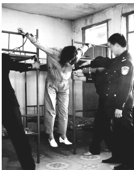
图片说明：酷刑演示“抻刑”

在突破中共严密封锁而在明慧网报道出来的法轮功学员遭迫害案例中，近期非法判重刑案例明显增加。根据明慧网的不完全统计，从 2013 年 1 月 1 日至 4 月 7 日，非法判刑案例 90 例（去年同期非法判刑