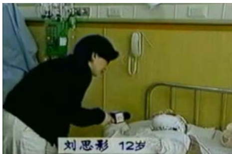
图片说明：中央电视台“天安门自焚案”中的“烧伤病人”，记者不穿卫生服，不戴口罩，大胆采访。

首届马来西亚女子马拉松于2013年4月7日，在雪兰莪州首府莎阿南正式开跑，这项由马来西亚铁人有限公司主办、莎阿南市议会支持的马拉松赛，吸引了两千位女士报名参加三项不同路程的竞赛。比赛当天，由法轮功学员组成的天国乐团受邀出席进行演奏（图）。