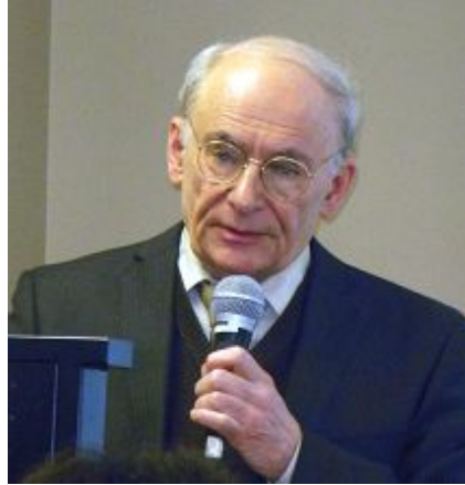
人权律师大卫·麦塔斯研讨会上发言

位于美国宾夕法尼亚州西南部的匹兹堡（Pittsburgh）坐落在奥里格纳河，蒙隆梅海拉河与俄亥俄河三河交会之处，曾是美国著名的钢铁工业城市，有“世界钢都”之称，现已转型为以医疗、金融及高科技工业为主之都市。匹兹堡大学医学中心（UPMC）是市内最大企业，而在世界器官移植