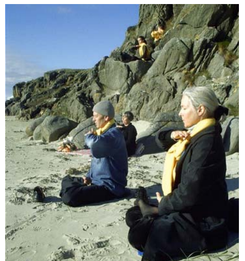
图片说明：西茜在海边炼功

随后这几年中，西茜用自己的积蓄和假期，去各地的健康博览会上介绍法轮功对健康的效应。她的热情讲