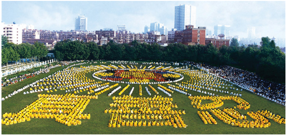
图片说明：李洪志师父在武汉共举办过五期法轮功传授班。法轮功备受武汉人民喜爱。这是 1997 年由 5000 多名武汉法轮功学员集体炼功，列队组字，上部分为法轮图形，下部分为“真善忍”，场面宏大，震撼人心。

那时我们每天早、晚都在炼功点集体炼功、读《转法轮》，越来越多的人走入法轮功修炼。有一次参加集体炼功，从古田路到黄浦路，全是法轮功学员在街道两边炼功。那时法轮