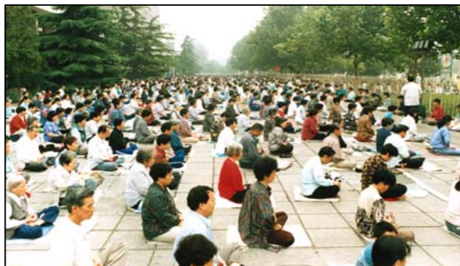
历史图片：北京法轮功学员集体晨炼

那是3月22日在云岗一个医院的大礼堂一大早就坐满了人，外边也站了很多，全场静静的，等待师父到来。八时许，师父从后台上来，全场起立掌声雷动。看见师父