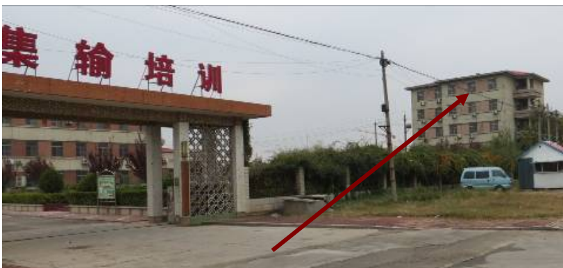
胜利油田集输培训学校洗脑班所在地