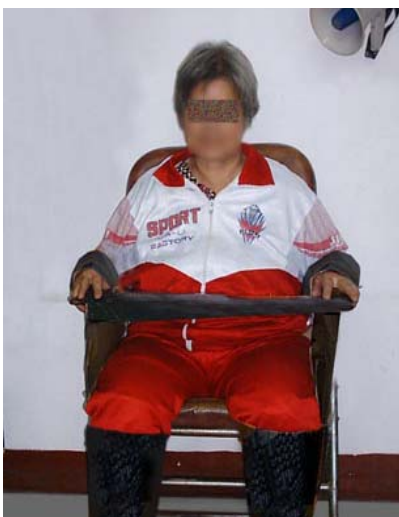
酷刑模拟：铁椅子酷刑

03 年腊月，我早 6 点看见楼下各监区学员为抗议监狱的劳役。被警察指使的犯人扒掉法轮功学员外衣，只穿线衣线裤，强迫坐在雪地里，同时犯人用竹板打每个学员的手。3 监区的学员被弄到菜窖里冻了 2 小时。