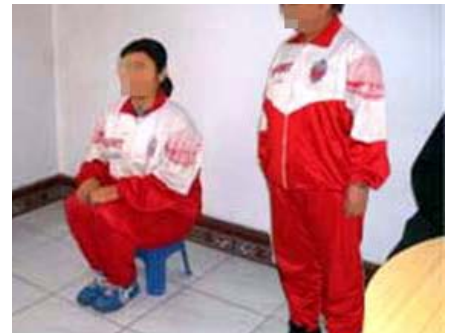
酷刑模拟：坐小椅子

里面的犯人告诉我，只要炼法轮功的刚进来，谁要是不穿红马甲、不配合，就给铐在另外的屋子里，如果法轮功学员要是喊的话，就用胶带缠住嘴。不“转化”的法轮功学员，罚坐小塑料凳子，除吃饭上厕所，找谈话外，就是让你坐凳子，晚上坐到 11 点，个别法轮功学员还被早上值班的、两三点就把她叫起来坐着。想方设法折磨。同时不断的用邪悟的学员来“转化”你，并不断的要挟你，如不“转化”就把你送到 11 监区去，那里的迫害更严重，是专门迫害法轮功学员的地方。