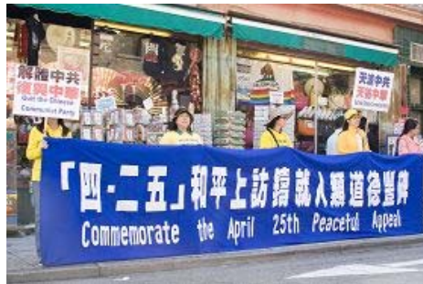
图片: 法轮功学员在街道拉起横幅

四月二十一日,旧金山阳光明媚、风和日丽,中国城的行人和游客不断,法轮功学员在花园角广场的炼