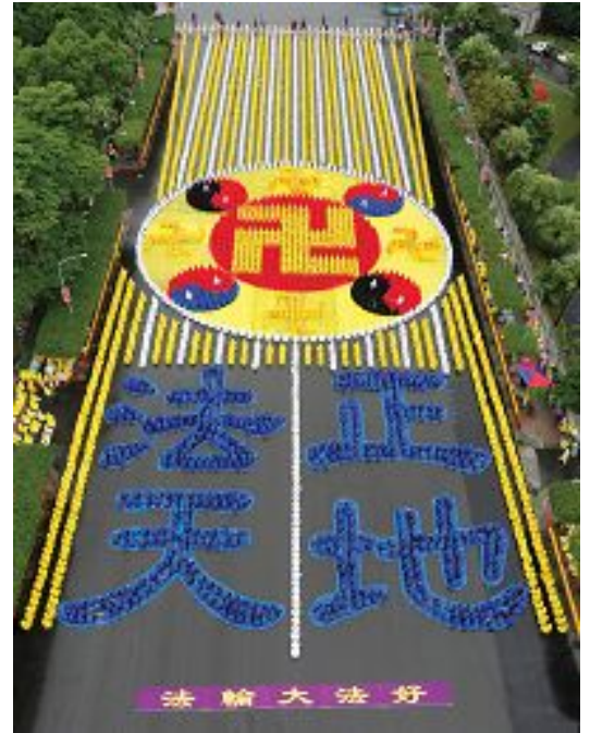
▲ 2012 年 11 月 17 日，台湾五千名法轮功学员在总统府前的广场上，排出“法正天地”及法轮功的标志法轮图形，场面宏伟壮观

借着“四·二五”事件而听闻法轮功的国际社会，在其后的十四年里，因法轮功学员坚持不懈地讲清真相，而越来越了解法轮功。如今，法轮功已经弘传至世界一百多个国家和地区，上亿人因修炼法轮功而身心受益。