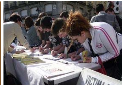
▲ 2013 年 4 月 2 日上午，西班牙法轮功学员在驻西中使馆前举行纪念“四·二五”北京和平上访十四周年活动。前来签字声援法轮功反迫害的民众络绎不绝