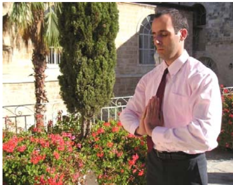
图：欧哈德在炼法轮功功法

欧哈德不想动这样的手术，就在互联网上搜寻有关自己症状的信息。在英文版的明慧网上，他读到了一位