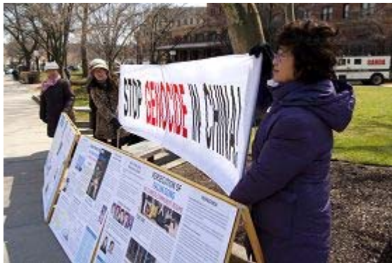
图：匹兹堡大学医疗中心（UPMC）外的揭露中共活摘器官真相点

在匹兹堡市中心，多辆载有“制止中共活摘器官”巨幅展板的车辆在主干道上巡行；在最繁华的市集广场和匹兹堡大学医疗中心前，义工们不畏风雪，连日举着“制止发生在中国的群体灭绝”横幅和展板，派发资料，征集请愿签名；在短短两周中，义工们派发了五万份有关活摘器官的特刊，逾一万一千多民众在制止活摘器官的征签表