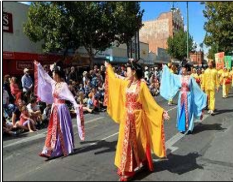
图：法轮功学员参加澳洲班迪戈复活节大游行

传播着光明和美好的希望。游行队伍通过一幅幅写有“真、善、忍”的彩幡、祥和的功法演示、明丽的扇子舞、欢快的腰鼓队，将中国悠久的传统文化栩栩如生地展现在观众们面前，获得人们由衷赞叹。游行队伍所到之处，观众无不鼓掌叫好，纷纷拿出手机和相机拍照录影。灿烂阳光下，法轮功学员的队伍闪耀着金光，将法轮大法的美好又一次带给了班迪戈人民。