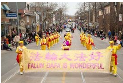
图: 法轮功学员组成的腰鼓队

本次复活节游行由多个政府部门和民间团体参与, 精彩纷呈的各色游行队伍, 吸引了数万市民驻足观看。连续第六年参加游行的法轮功天国乐团和腰鼓队, 以其明亮的服装和雄壮的鼓乐声令人眼前一亮。由八十余名法轮功学员组成的天国乐团是游行队伍中最大、最壮观的队伍, 其