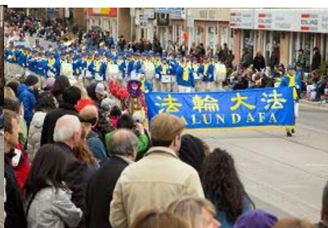
图: 法轮功学员组成的天国乐团

天国乐团纪律很好, 并指着腰鼓队说: “这个很漂亮, 很平和, 这证明加拿大是一个热爱自由的国家, 可以很开放的庆祝人们的文化和信仰, 非常好。”