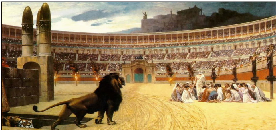
图：《基督殉道者最后的祈祷》，描述了古罗马残酷迫害基督教徒的情景：竞技场周围的柱子上，左边是遭受火刑的基督徒，右边是十字架处死的基督徒，中间一群基督徒则将被猛兽撕碎，而看台上无数的民众毫无同情心的观看这惨烈的情景。

一天就有 5000 到 7000 人，甚至上万人不幸死去。强大的罗马帝国被摧毁了。历史学家伊瓦格瑞尔斯亲身经历了第四次大瘟疫。伊瓦格瑞尔斯记载道：“在有些人身上，它是从头部开始的，眼睛充血、面部肿胀，继而是咽喉不适，再然后，这些人就永远地从人群当中消失了。”伊瓦格瑞尔斯说：“也有一些人甚至就居住在被感染者中间，并且还不仅仅与被感染者，而且还与死者有所接触，但他们完全不被感染。”看来瘟疫是长着眼睛的，是有选择性的！