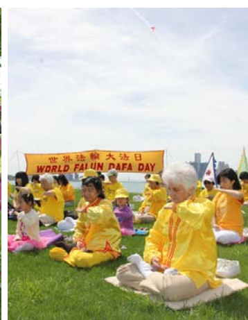
图（依序）：台湾大法弟子游行庆祝大法日；美国华盛顿 DC 法轮功小弟子们；美加边境的底特律河畔集体炼功