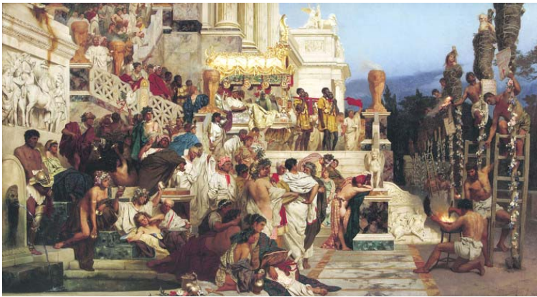
图:《尼禄的火炬》描绘罗马皇帝尼禄用火刑迫害基督徒的情景。右边基督徒被包裹着干草准备点燃;左边贵族、平民悠然地等待欣赏。