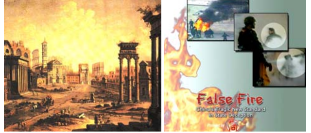
上图:公元64年7月,尼禄纵火罗马城,嫁祸基督徒。