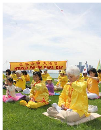
图（依序）：台湾大法弟子游行庆祝大法日；美国华盛顿 DC 法轮功小弟子们；美加边境的底特律河畔集体炼功