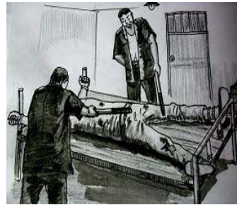
酷刑演示：绑床并电击

见她仍不屈服，“610”丧心病狂得把她送进精神病院，强行注射破坏大脑中枢神经的致幻药物，指示医生用铁钩针从她嘴里穿过去，将嘴搅得鲜血直流，见她仍不屈服，又用电棍击打，打完后将她“大”字形绑在床