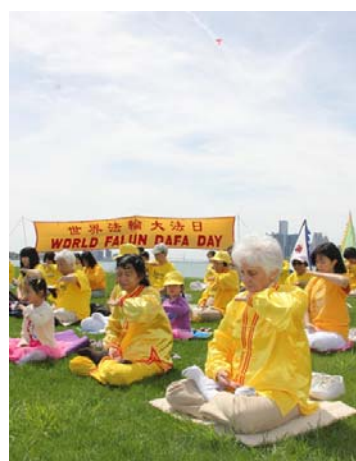
图（依序）：台湾大法弟子游行庆祝大法日；美国华盛顿 DC 法轮功小弟子们；美加边境的底特律河畔集体炼功