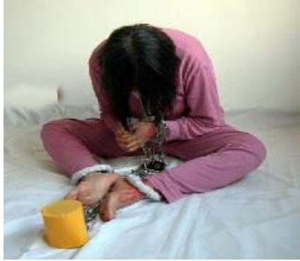
迫害酷刑示意图：：手铐脚镣

临沂市六一零与兰山区检察院、法院却互相勾结, 无视法律, 耍刁使横, 执法犯法, 屡次撒谎欺骗法轮功学员家人与律师, 阻挡正义律师会见当事人, 在一审阶段偷偷开庭, 不让正义律师辩护, 并非法重判两名法轮功学员九年和七年重刑。两名法轮功学员上诉到临沂市中院后, 临沂市中院无视中共邪党迫害法轮功违法违规的清晰事实, 枉顾一审偷偷开庭, 没有让法轮功学员得到应有辩护和一审强行诬判等违法行为, 竟然维持原判, 完全丧失法官公正的原则和做人的基本良知。