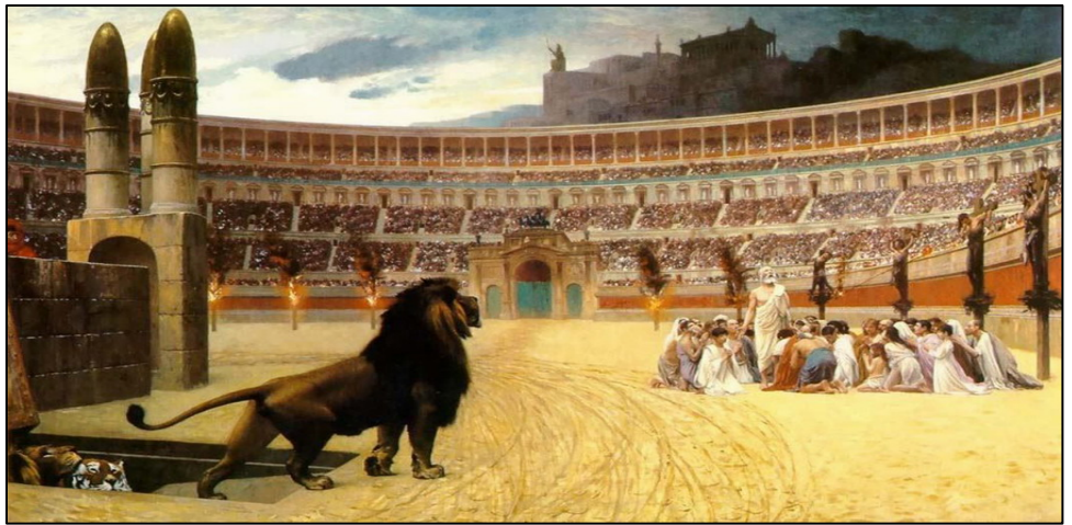
图：《基督殉道者最后的祈祷》，描述了古罗马残酷迫害基督教徒的情景：竞技场周围的柱子上，左边是遭受火刑的基督徒，右边是十字架处死的基督徒，中间一群基督徒则将被猛兽撕碎，而看台上无数的民众毫无同情心的观看这惨烈的情景。

元 542 年，罗马爆发第四次大瘟疫，此次瘟疫之凶猛波及整个欧洲大陆。一天就有 5000 到 7000 人，甚至上万人不幸死去。强大的罗马帝国被摧毁了。历史学家伊瓦格瑞尔斯亲身经历了第四次大瘟疫。伊瓦格瑞尔斯记载道：“在有些人身上，它是从头部开始的，眼睛充血、面部肿胀，继而是咽喉不适，再然后，这些人就永远地从人群当中消失了。”伊瓦格瑞尔斯说：“也有一些人甚至就居住在被感染者中间，并且还不仅仅与被感染者，而且还与死者有所接触，但他们完全不被感染。”看来瘟疫是长着眼