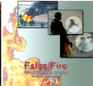
上图：公元 64 年 7 月，尼禄纵火罗马城，嫁祸基督徒。 右图：2001 年 1 月，中共江泽民集团炮制天安门自焚假案，栽赃法轮功。国际获奖纪录片《伪火》，揭示了该案的诸多破绽，如：刘春玲并不是被烧死，而是被警察用重物击打头部倒下；王进东的衣服被烧坏，两腿之间装有汽油的塑料雪碧瓶在火焰中却完好无损，等等。