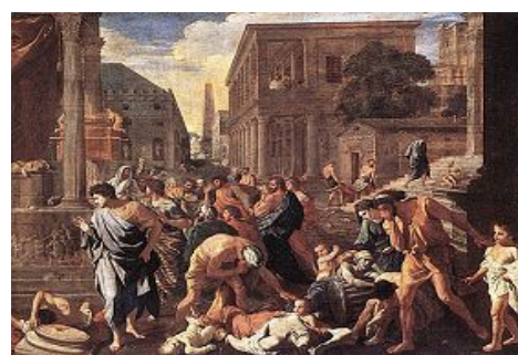
油画《阿什杜德的瘟疫》刻画了当时第四次大瘟疫可怕的情景。

报应篇： 古罗马对基督徒的迫害是残酷的，但同时上天对其的报应也是毁灭性的，期间先后四次大瘟疫横扫古罗马，累计超过一亿人死于大瘟疫。公元 542 年，罗马爆发第四次大瘟疫，此次瘟疫之凶猛