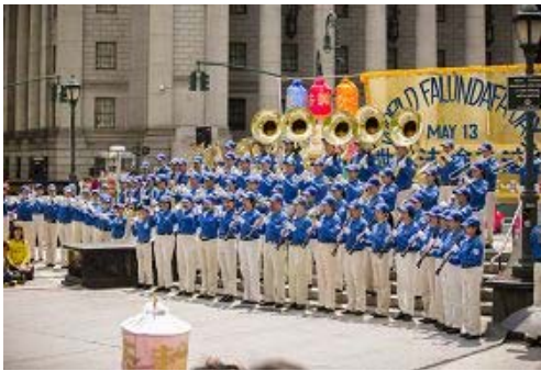
天国乐团在纽约曼哈顿富利广场表演