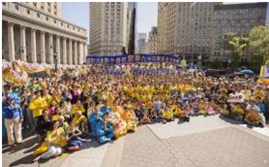
全体纽约大法弟子于广场祝师尊生日快乐