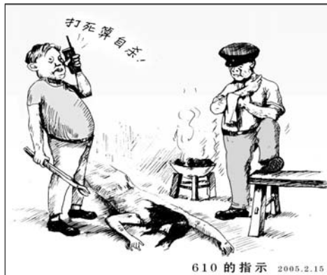
610 的指示：打死算自杀

在接下来的迫害中，我彻底认清了中共。当我在外躲避洗脑班（精神摧残场所）迫害时，警察闯到我家找到我先生，先生在电话里哀求我回来，那口吻，就象要给我下跪似的。