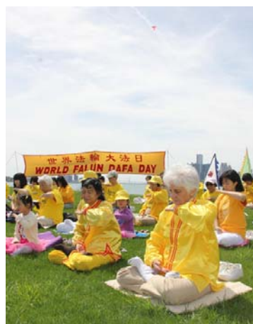
图（依序）：台湾大法弟子游行庆祝大法日；美国华盛顿 DC 法轮功小弟子们；美加边境的底特律河畔集体炼功